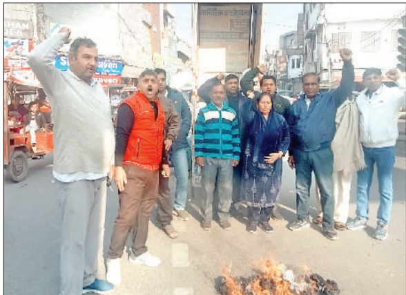
सोनीपत। विरोध प्रदर्शन करते हुए आम आदमी पार्टी पदाधिकारी एवं सदस्यगण।