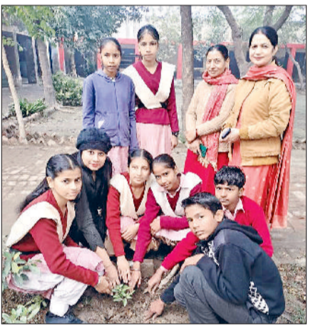
सोनीपत। कार्यक्रम के दौरान पौधरोपण करती छात्राएं।