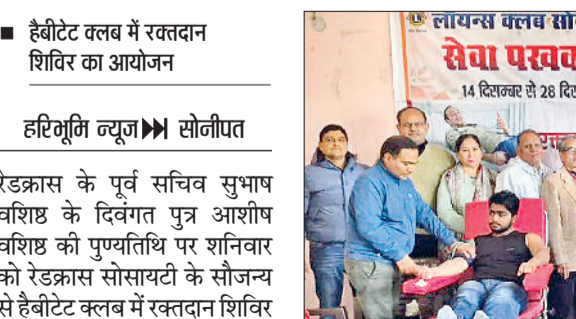
सोनीपत। रक्तदाताओं का हौसला बढ़ाते मुख्य अतिथि व अन्य।