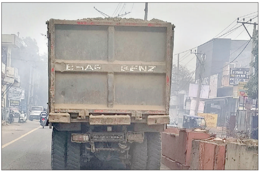
गन्नौर। रोड पर बिना नंबर प्लेट व बगैर मिट्टी पर तिरपाल लगाए जाते हुए हाइवा चालक।

गन्नौर शहर में इन दिनों बिना नंबर प्लेट के मिट्टी से भरे हाइवा वाहन आमजन के लिए गंभीर परेशानी और खतरे का कारण बने हुए हैं। खासकर शहर के सबसे व्यस्त रेलवे रोड पर तेज रफतार से गुजरते ये भारी वाहन आए दिन हादसों को न्योता दे रहे हैं। हाइवा से उड़ती धूल के कारण दृश्यता कम हो रही है, जिससे दौपहिया व चारपहिया वाहन चालकों को भारी दिक्कतों का सामना करना पड़ रहा है। स्थानीय लोगों का आरोप है कि इस गंभीर समस्या पर पुलिस और प्रशासन कोई ध्यान नहीं दे रहा। रेलवे रोड पर सुबह से देर रात तक मिट्टी से लदे हाइवा लगातार आवाजाही करते देखे जा सकते हैं। इनमें से कई वाहनों पर नंबर प्लेट नहीं लगी है, जबकि कुछ के नंबर स्पष्ट नहीं हैं। नियमों को खुलेआम धजियां उड़ाते हुए ये वाहन तेज गति से गुजरते हैं, जिससे सड़क पर चल रहे राहगीरों, स्कूली बच्चों और बुजुर्गों के लिए खतरा बना रहता है। स्थानीय दुकानदारों का कहना है कि हाइवा की तेज रफतार और भारी