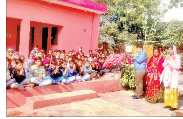
सोनीपत। कार्यक्रम के दौरान बच्चों के साथ संस्था के पदाधिकारी एवं सदस्यगण।

वजन के कारण सड़क भी क्षतिग्रस्त हो रही है। कई बार अचानक ब्रेक लगने या मोड़ पर तेज गति के चलते दुर्घटनाएं होते-होते बची हैं। दौपहिया वाहन चालक विशेष रूप से असुरक्षित महसूस कर रहे हैं, क्योंकि धूल के कारण सामने से आ रहे वाहन दिखाई नहीं देते। लोगों का कहना है कि यदि समय रहते कार्रवाई नहीं की गई तो कोई बड़ा हादसा हो सकता है।