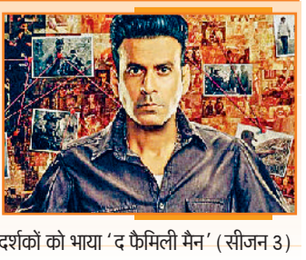
दर्शकों को भाया 'द फैमिली मैन' (सीजन 3)

बीते कुछ वर्षों में एंटरटेनमेंट की एक समानांतर दुनिया विकसित हुई है। इन दिनों थिएटर में रिलीज फिल्मों के साथ-साथ ओटीटी शो को भी दर्शकों का खूब प्यार मिल रहा है। 'द बैड्स ऑफ बॉलीवुड', 'ब्लैक वॉटर', 'पाताल लोक (सीजन 2)', 'पंचायत (सीजन 4)', 'मंडला मर्डर्स', 'खोब', 'स्पेशल ऑप्स (सीजन 2)', 'आका' : द बंगल चैप्टर', 'द फैमिली मैन (सीजन 3)' और 'किंगडम जस्टिस: ए फैमिली मैट्टर' जैसे ओटीटी शो को दर्शकों ने खूब पसंद किया।